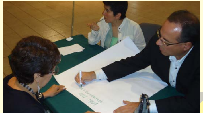
en diferentes convocatorias.

Su trabajo lo realiza a través de la articulación de actores, asesorías, e investigaciones, especialmente en las áreas de cultura, economía, cultura de paz, ética y política para la búsqueda de opciones viables para el desarrollo sustentable, la cohesión social y el desarrollo humano y comunitario. Finalmente a través de las publicaciones se realiza la teorización de la práctica para la construcción de conocimiento hacia el proceso de discusión y trabajo colectivo.