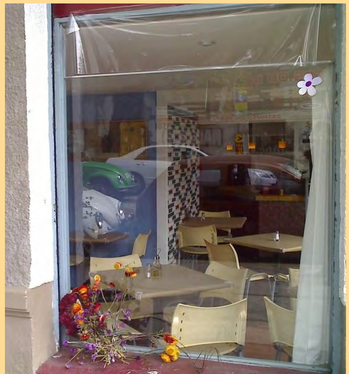
Restaurante Pronto&Ricco Salvador Díaz Mirón #147 (esquina con Sabino)

Y ojalá pudiéramos leer mañana sobre una revista, la palabra SantaMaríaLaRiberización.