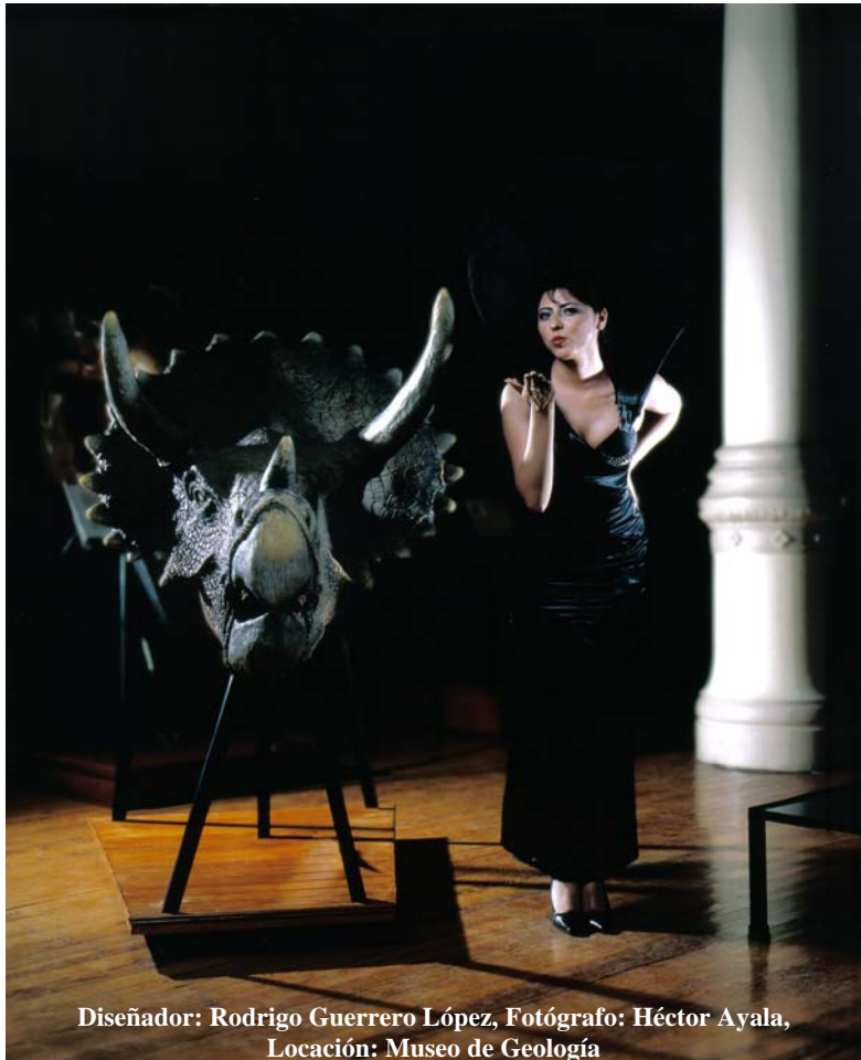
Diseñador: Rodrigo Guerrero López, Locación: Museo de Geología

En los pasados dos meses como parte de las actividades de la Mesa de Articulación de “Santa María la Ribera, Comunidad Educativa y Cultural”, se generó una convocatoria conjunta entre el Instituto El Centro de la Moda, ICE Moda; y el Centro Lindavista, ambos ubicados en nuestra colonia, invitando a jóvenes creativos diseñadores de moda y fotógrafos a participar en “Modajos Históricos”, concurso que busca la difusión de expresiones artísticas teniendo como escenario nuestro barrio.