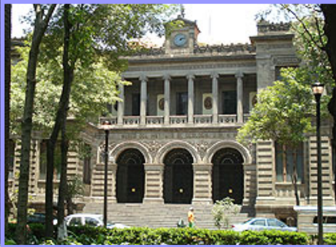
Fachada principal Instituto Geológico Nacional, 1904