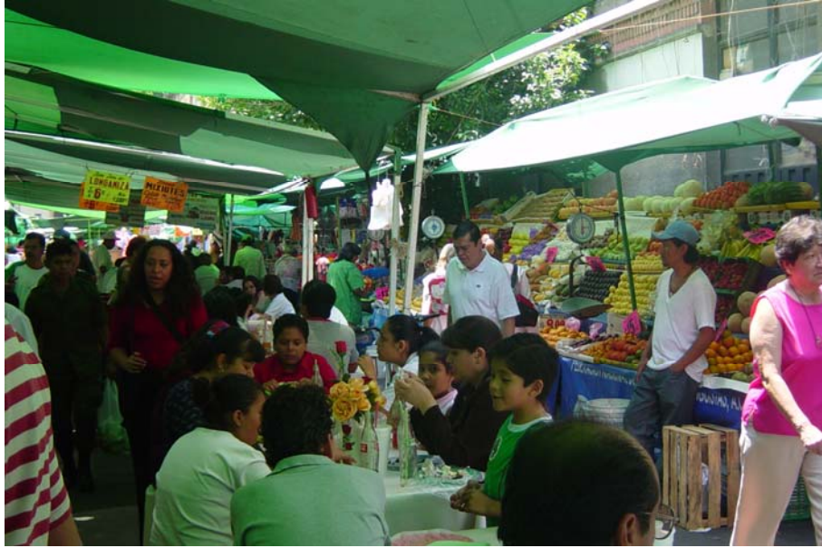
Tianguis Santa María la Ribera