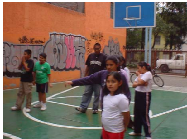
Módulo Deportivo Alzate