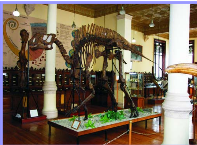
Kritosaurus sp. Dinosaurio "Pico de Pato"